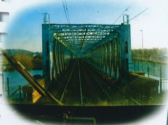
Vue d'un poste de pilotage

Cette lettre a pour objectif d'informer de l'avancement du chantier et des différentes modifications de circulation qui interviendront aux différentes phases, notamment entre les quais et la gare.